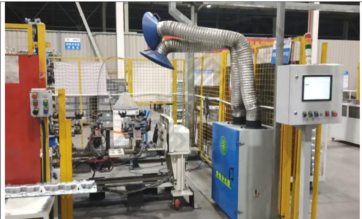
移动式焊烟净化器