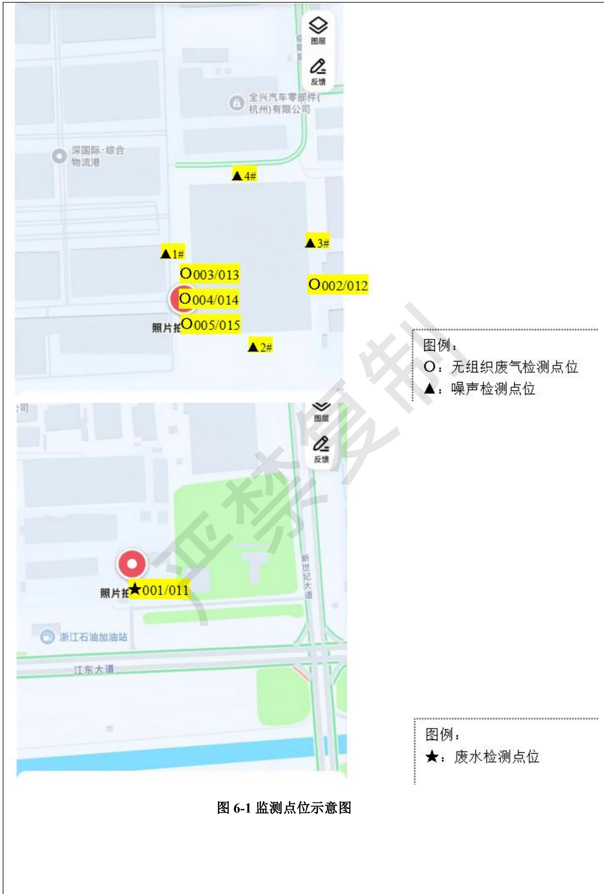
图 6-1 监测点位示意图